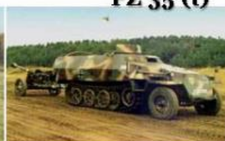
Sd Kfz 251