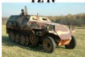
Sd Kfz 250