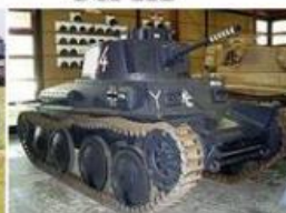
PZ 38 (t)