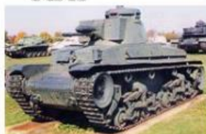
PZ 35 (t)