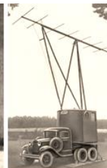
РЛС РУС - 2

Особо острым, в 1940-1941 гг, оставался вопрос о командных кадрах. Боеспособность армии снижало массовое выдвижение на высшие командные должности молодых командиров, этот недостаток предполагалось устранить к концу 1941 года. Кадровый командный состав, к началу войны, был молод – 87% были в возрасте до 35 лет, 83% командиров находились в армии (вместе с 2-х – 3-х годичным пребыванием в вузе) менее 7 лет, 60% офицерских кадров происходило из рабочих и крестьян, около 79% состояло в партии или в комсомоле. Самым крупным недостатком было малое количество опыта работы на занимаемой должности, большая часть командиров дивизионов, в Западном военном округе, занимало должности с осени 1939 и 1940 гг, на должностях командиров батарей было много лейтенантов досрочного выпуска из артиллерийских училищ, малый стаж в должности следствием волны репрессий 1937 - 1938 гг. и 1940–1941 г. Во время массового развертывания новых частей и соединений командиры часто получали новое назначение, еще не успев освоиться и войти в курс дела на новом месте службы. Все это обостряло дефицит командного состава и крайне отрицательно влияло на его качество. Кадровый состав РККА на февраль 1941 года: