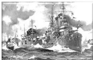
Военно – морской флот