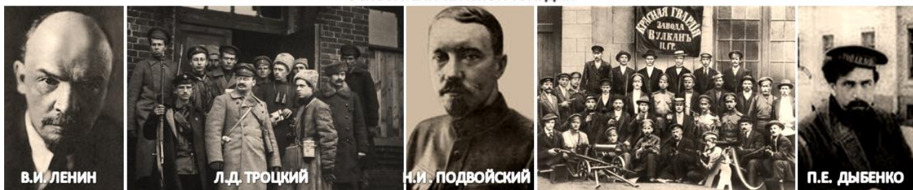
ОСНОВАТЕЛИ КРАСНОЙ ГВАРДИИ

Советского государства. Возникла необходимость демобилизации старой армии и создание новой советской армии.