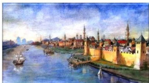
КИЛИЯ. ПОРТ НА ДУНАЕ