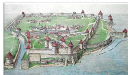
БЕЛГОРОД-ДНЕСТРОВСК. ПОРТ НА МОРЕ

По стране было рассеяно значительное количество городов, опоясанных деревянными и земляными укреплениями. Они защищали от отдельных грабительских набегов, но уничтожались при осаде большим войском. Кроме крепостей и городов обычно хорошо были укреплены монастыри,