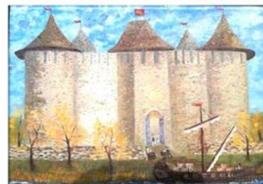
СОРОКА. ПОРТ НА ДНЕСТРЕ